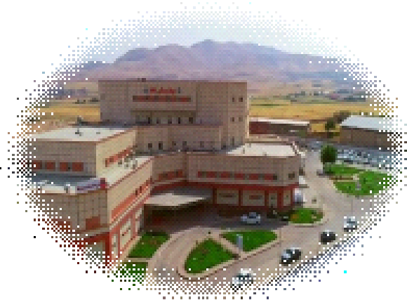
واحد آموزش بیمارستان شفا سقر

اقدامات لازم برای پیشگیری از پارگی یا سوراخ شدن کیسه آب :